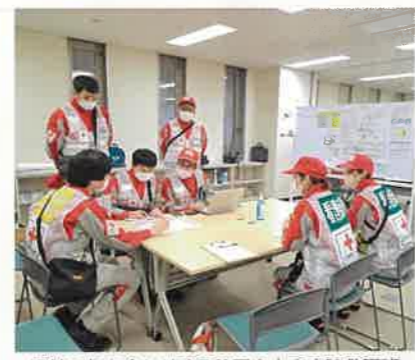
現地で打ち合わせする静岡赤十字病院救護班

令和6年1月1日に発生した能登半島地震では、被災地に救護班4班、災害医療コーディネーターチーム1班を派遣しました。（1月末時点）