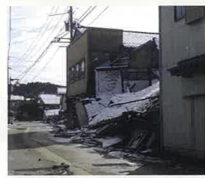
能登半島地震の被害状況