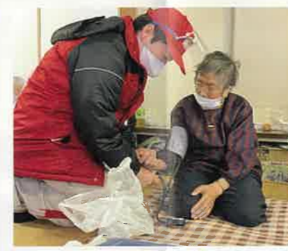
避難所での診療の様子