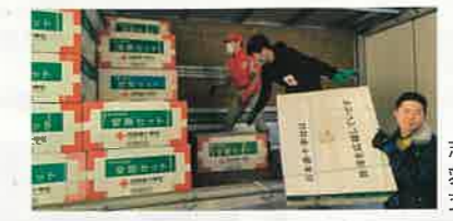
志賀町に救援品を届ける支部職員

能登半島地震では、石川県支部の要請を受け、1月4日に志賀町へ毛布750枚、安眠セット225セットを届けました。