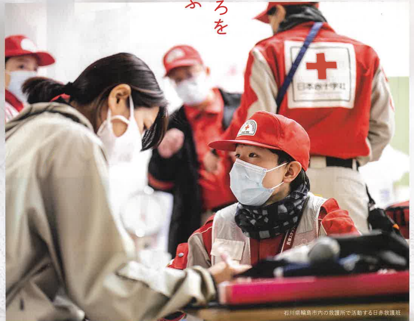
石川県輪島市内の救護所で活動する日赤救護班