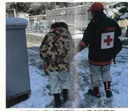
被災者に寄り添う浜松赤十字病院職員