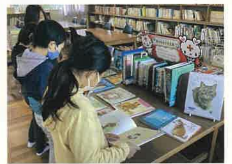
青少年赤十字文庫を楽しむ児童