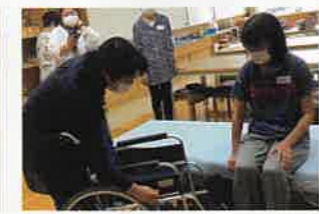
健康生活支援講習

令和6年度は、これらの講習を約600回、22,000人の方に受講いただく予定としております。「いざ!」というときのための知識や技術を広めていきます!