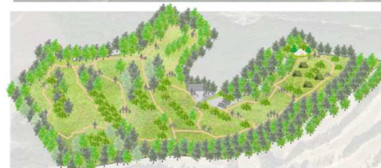
<自然との共生ゾーン整備イメージ（案）>