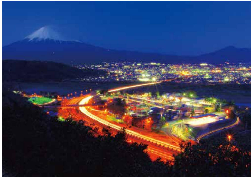
第8回 富士山百景写真コンテスト グランプリ