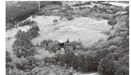
◀埋立地の測量等に活用するドローン

また、ドローンによる測量については、ドローンの操縦ライセンスを今年度、土地対策課職員2名、新年度も2名が取得するとともに、測量のノウハウを学ぶため、専門業者からの技術指導を受ける予定です。違反業者を告発する際には測量データが必要となるため、違反地の土量、面積を測定したデータを蓄積し、市で管理しているカルテに反映していきます。さらに、県において、全県で統一したカルテの運用が開始された際には、蓄積したデータを移行することを考えています。