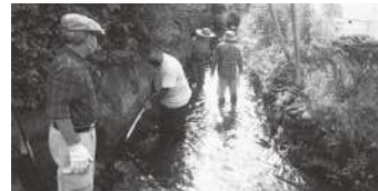
◀地区住民による河川清掃

答 新年度の春掘については、市から感染症対策等の注意喚起をした上で町内会が実施の判断をしており、現時点で約7割の町内会が実施する予定です。なお、中止する場合には、町内会からの要望を受け、必要に応じ市がしゅんせつや護岸の維持修繕を行います。春掘は、田植え前の水路管理や水害防止、河川美化推進に加え、地区住民のつながりを深める伝統的な地区行事でもあるため、引き続き市と地区が連携、協力しながら実施していきたいと考えています。