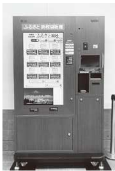
ふるさと納税自動販売機(イメージ)▶

答 自動販売機に表示される返礼品を選択し、寄附申込手続を行うと発行される引換券を富士川楽座の窓口で提示すると、その場で返礼品を受け取れる仕組みです。市としてもインターネット上での申込みに比べ、発送に係る経費負担がないというメリットがあります。