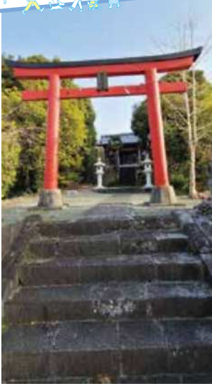
▲三ツ沢三度時稻荷神社

岳南原田駅から200メートルほど東にある滝川沿いを富士山に向かって北へ行くと「鎧ヶ淵親水公園」があります。入口の石碑には、「治承4(1180)年10月の富士川の合戦のとき、源頼朝がこの淵の岩に鎧をかけ身体を洗ったため鎧ヶ淵と呼ばれるようになった」と紹介されています。今も豊かで澄んだ湧水が清らかに流れ、当時、この水で身を清めた武将の凛とした気分を思わずにはられません。