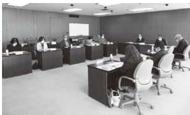
▲議会モニター会議の様子

できるよう、開催時期や時間について検討すべきという提案をいただくなど、活発な意見交換ができました。