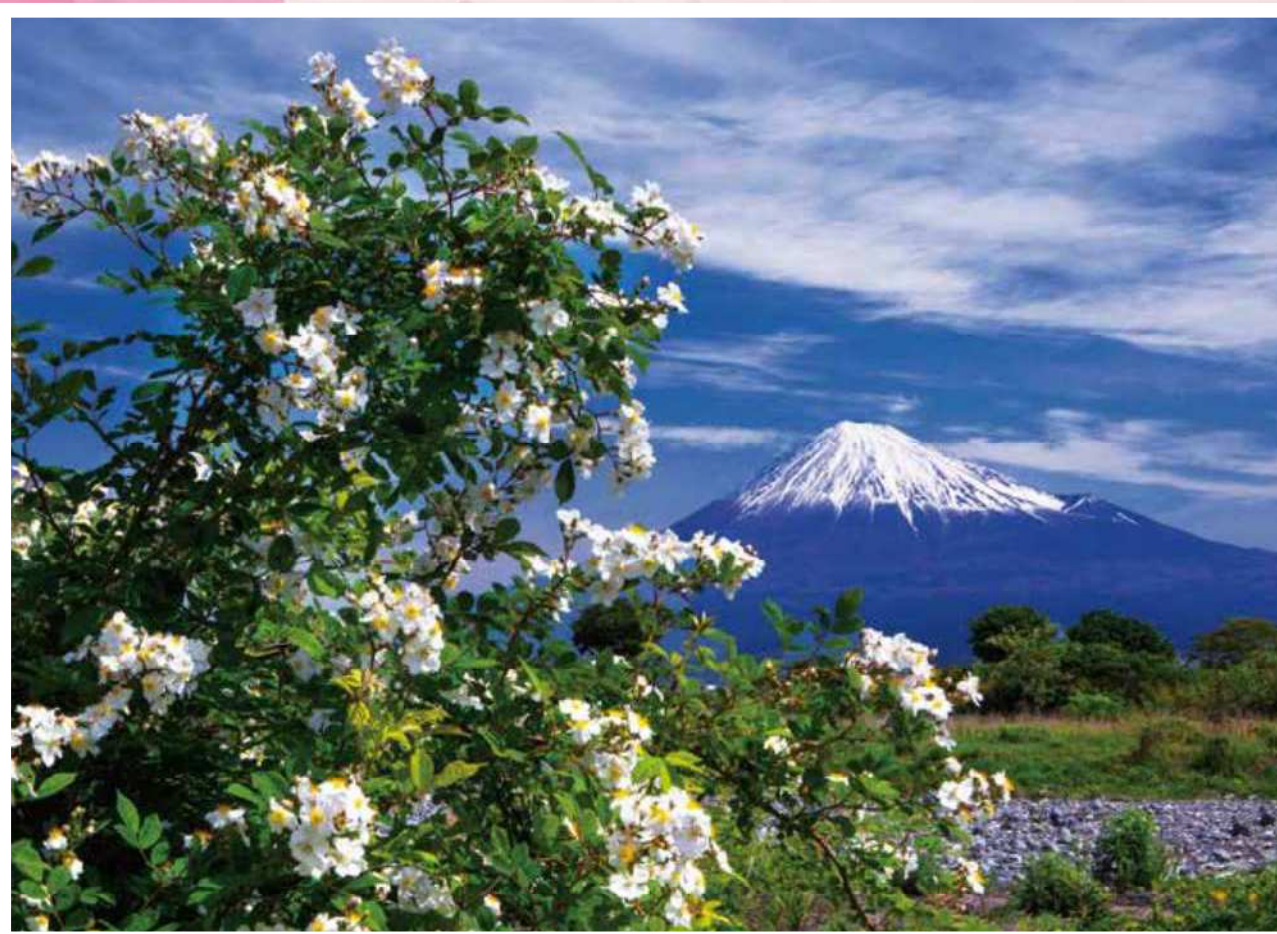
第16回 富士山百景写真コンテスト審査員特別賞作品 「咲き誇る野いばら」(エリア:富士川鉄橋周辺)