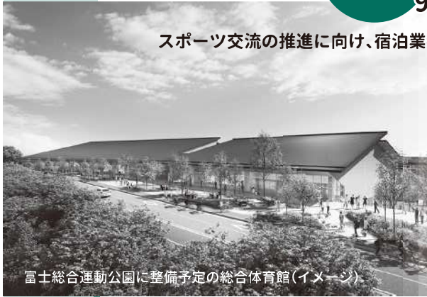
富士総合運動公園に整備予定の総合体育館(イメージ)

※PFIとは… プライベート・ファイナンス・イニシアチブの頭文字を取ったもので、公共事業を行う際、安価で優れた公共サービスを提供するため、民間資金と民間ノウハウの活用により施設整備や維持管理・運営等を行う手法のことです。