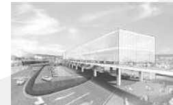
▲富士駅北口公益施設(イメージ)

本施設は、国内外に発信できる重要な資産として次世代に引き継ぎたいと考えており、意匠や構造、環境面に至るまで、本市を象徴する建築物となるよう整備していく。