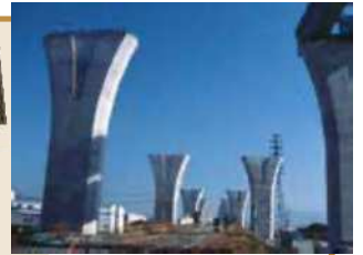
▲建設中の新東名橋脚

東名高速道路の渋滞緩和を目的とした新東名高速道路の建設に向けた国の動きを受け、市議会では、平成3年5月、第二東名自動車道対策特別委員会を設置し、アクセス道路の整備等の課題解決に向け、議論を始めました。