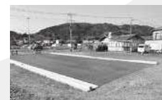
▲整備中の五味島岩本線

ン設置を優先して進める方針である。 未整備区間である四ツ家工区終点から身延線高架下までの四ツ家東工区は、新橋開通までの拡幅整備が現実的に困難であることから、歩行者の安全を確保するため、部分的な暫定歩道や待避所の設置、道路内の電柱の道路外への移設等を実施していく。 市道中島林町線は、身延線以西の狭小区間を解消し安全な通行を確保するため、既設水路を暗渠化する暫定的な道路拡幅工事を行っている。