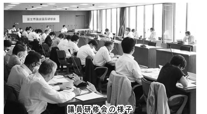
議員研修会の様子

共立蒲原総合病院の経営状況等について、当病院事務長より説明を受け、その後、意見交換を行いました。厚生労働省から再編統合が必要な病院とされたことで注目を集める中、経営努力を続けているとのことであり、議会としても公立病院の在り方について認識を深め、今後の議論につなげていきます。