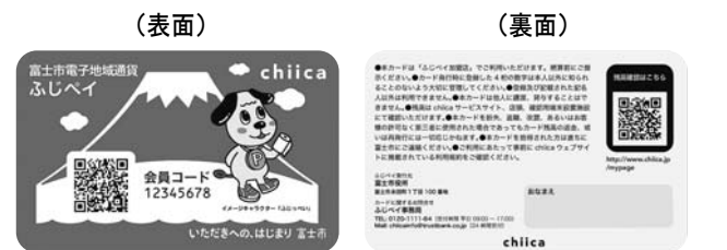
カード形式の電子商品券

答 商品券の使用方法は、決済時に利用客のカードもしくはスマートフォンアプリに表示されたQRコードを読み取る方法となります。店舗側は、自前のスマートフォンもしくはタブレット端末に専用アプリをダウンロードすれば使用できるほか、換金手数料も市が負担するため、負担は発生しません。また、タブレット端末等がない店舗には、端末を貸し出すとともに操作方法を丁寧に説明したいと考えています。