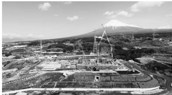
約1年後の稼働に向け、進む工事の様子