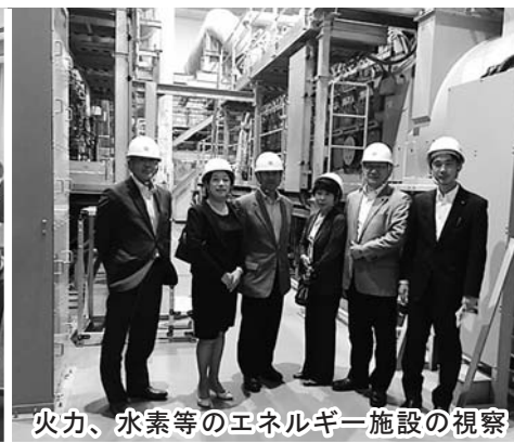
火力、水素等のエネルギー施設の視察