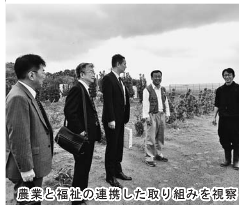
農業と福祉の連携した取り組みを視察