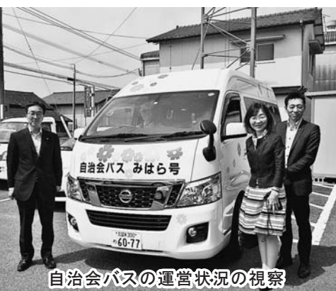
自治会バスの運営状況の視察