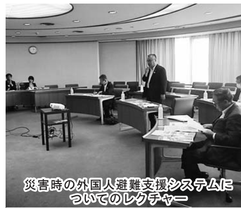
災害時の外国人避難支援システムについてのレクチャー