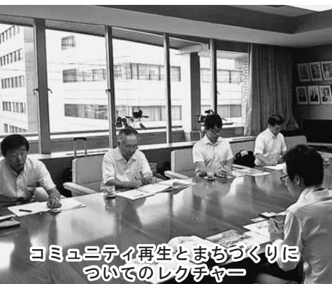
コミュニティ再生とまちづくりについてのレクチャー