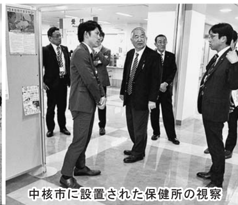
中核市に設置された保健所の視察