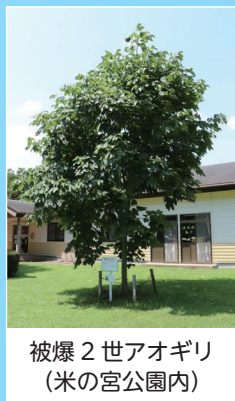
被爆2世アオギリ (米の宮公園内)

私たちが生きていく世界が平和であるために、一人一人が平和について考えてみましょう。