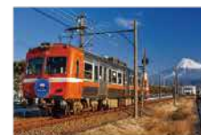
岳南電車 Gakunan Train

レトロな雰囲気と、富士山を背景に走る姿が人気のローカル線。鉄道本体としては初の「日本夜景遺産」である。月2回開催される「夜景電車」では、工場夜景が満喫でき、他にも年間を通じさまざまなイベント列車が運行する。