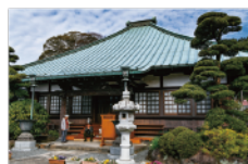
医王寺 Ioji Temple

市内東部の根方街道の北側にたたずむ古刹・医王寺。その参道の両脇にある湧水公園では、富士山の地下水が湧き水となって流れる。柳の並木や、湧水をたたえた池で鯉がのんびりと泳ぐ景色は、風情があふれる。