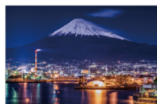
ふじのくに田子の浦みなと公園 Fujinokuni Tagonoura Port Park

北に富士山、南に駿河湾を望む絶景スポット。アスレチック遊具、山部赤人の歌碑、歴史学習施設などもあり、家族連れや観光客にも人気。展望台「富士山ドラゴンタワー」からは、360度のパノラマを楽しめる。