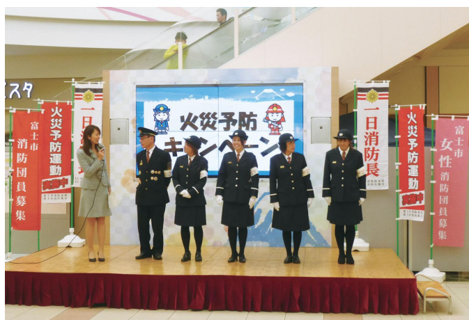
火災予防の啓発活動