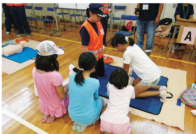
応急手当の普及活動

活動内容 応急手当の普及活動、火災予防の啓発活動など 対 象 年齢18歳以上、かつ富士市の区域に居住する 学生又は通学する学生