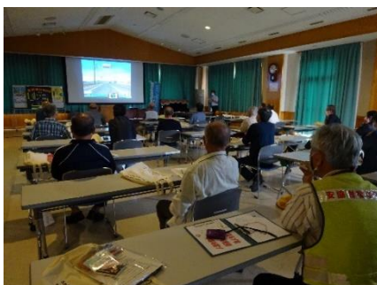
岩松北地区 KYT 講習会