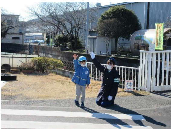
てんま保育園 歩行交通安全教室