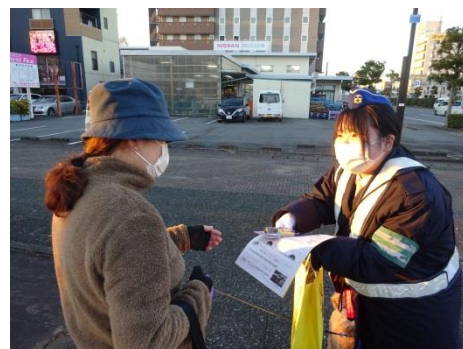
夕暮れ時のライトオン作戦 街頭広報活動