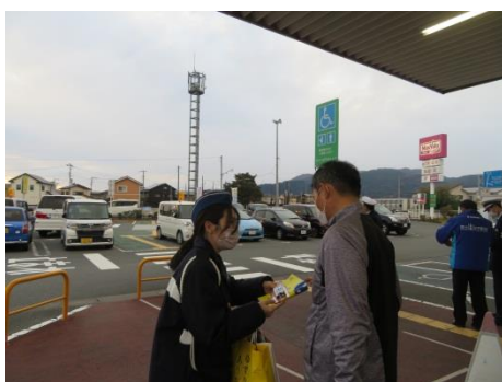
死亡事故発生に伴う広報啓発活動