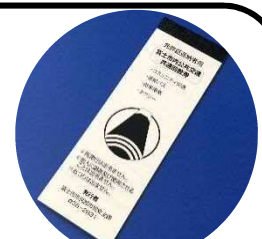
富士市内公共交通 共通回数券

※65歳以上で（平成29年4月1日以降に）運転免許を返納又は失効された方が対象です。