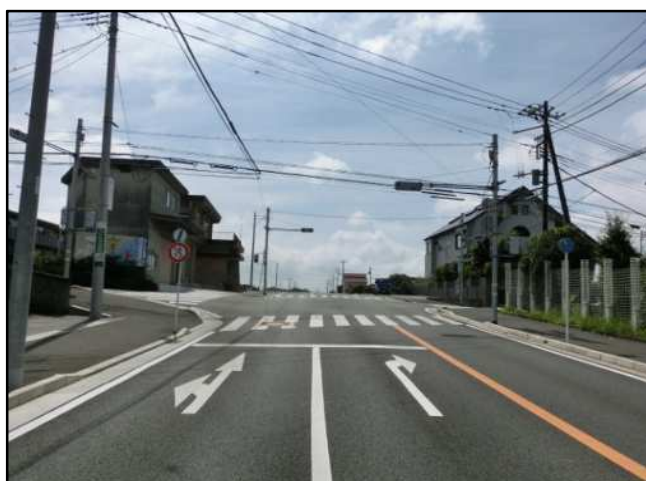
【完成写真】矢印①の方向から撮影