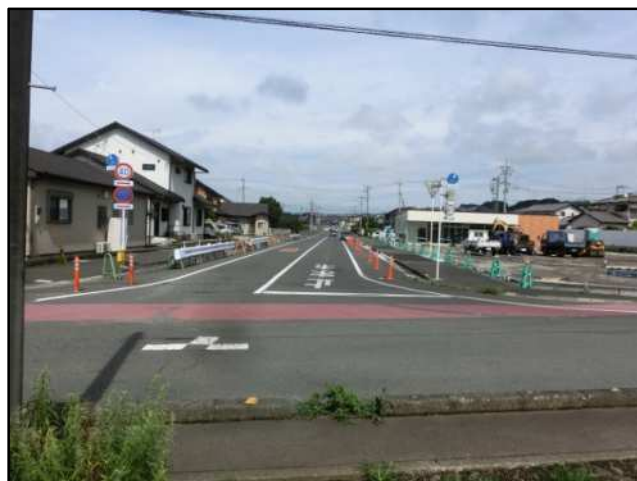
【完成写真】矢印②の方向から撮影