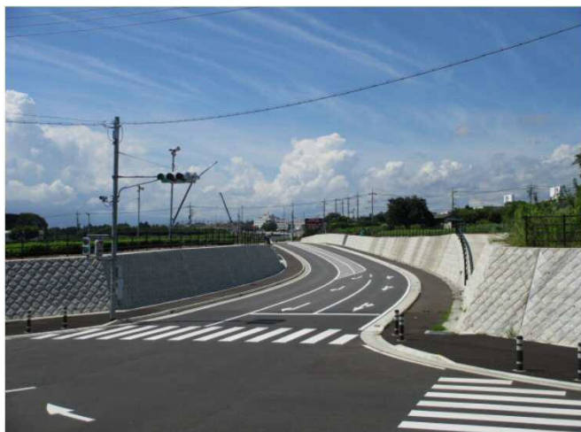
【完成写真】矢印①の方向から撮影