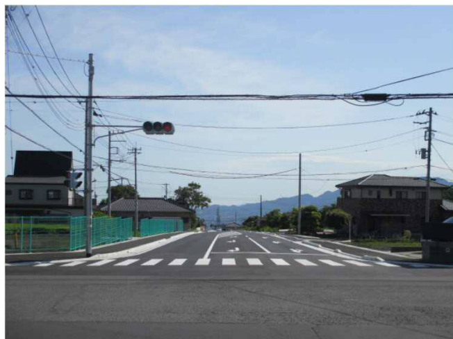
【完成写真】矢印②の方向から撮影