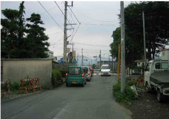
【整備前写真】 矢印の方向から撮影