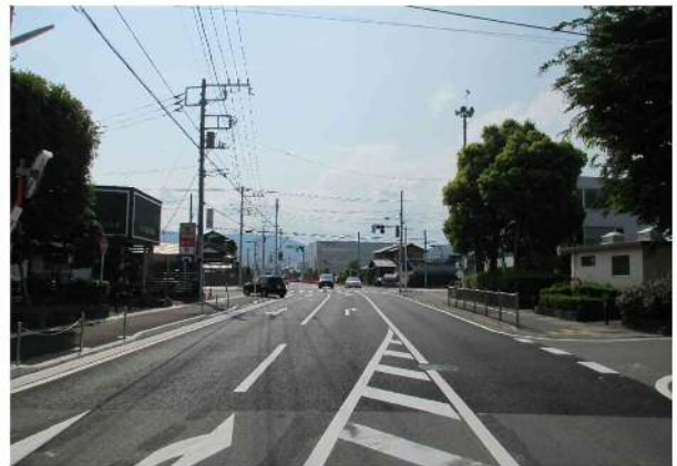
【完成写真】 矢印の方向から撮影