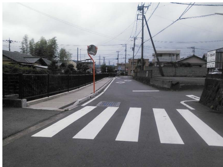
【完成写真】 矢印の方向から撮影