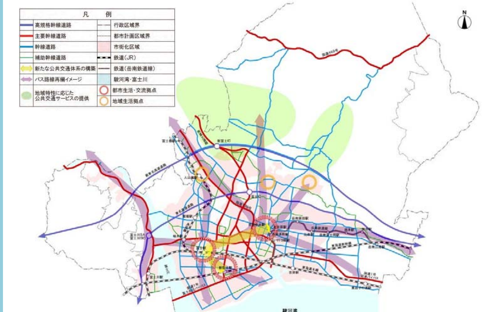
図3 都市交通の基本方針図（富士市都市計画マスタープラン）

富士市都市計画マスタープランでは、下図のような都市交通の基本方針を掲げており、都市計画道路等の整備により、主要幹線道路や幹線道路等を骨格とした道路網の構築を目指しています。