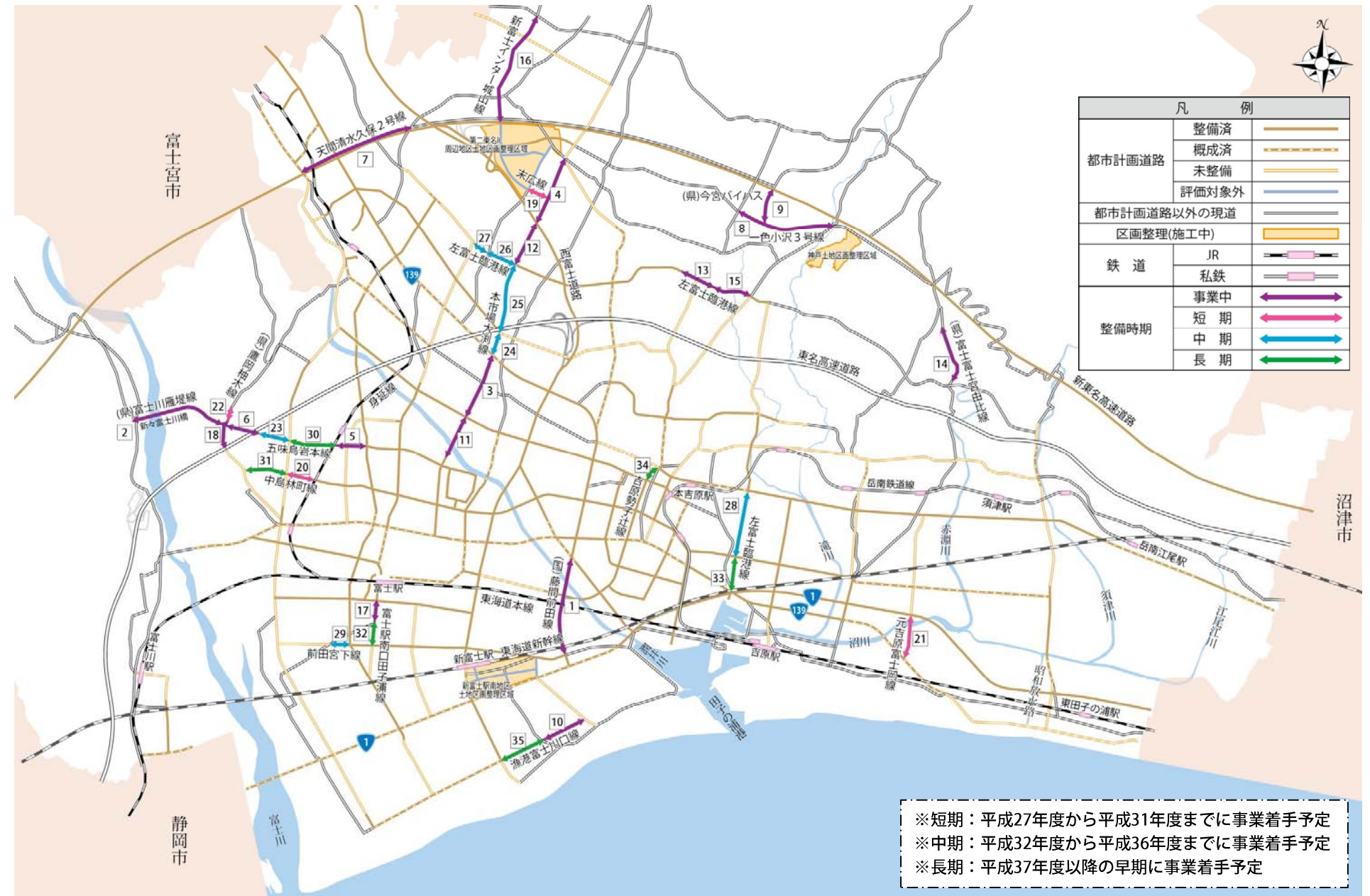
図5 道路整備プログラム総括図

※短期：平成27年度から平成31年度までに事業着手予定 ※中期：平成32年度から平成36年度までに事業着手予定 ※長期：平成37年度以降の早期に事業着手予定