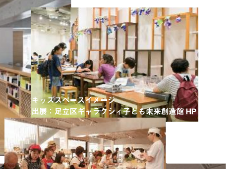
キッズスペースイメージ