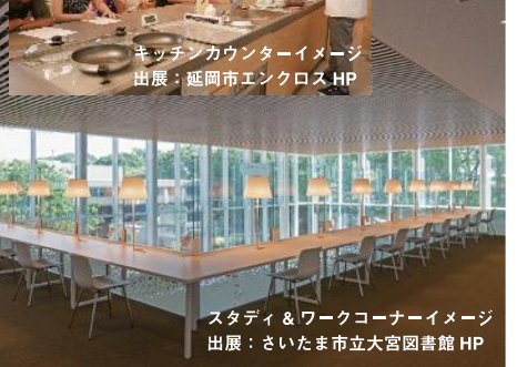
スタディ＆ワークコーナーイメージ