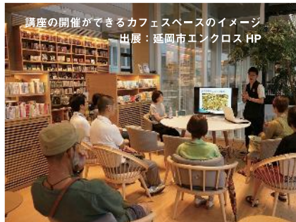
講座の開催ができるカフェスペースのイメージ