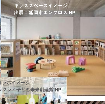
キッズスペースイメージ