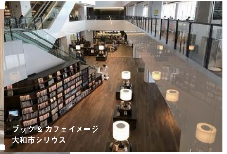
ブック＆カフェイメージ 大和市シリウス