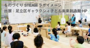
ものづくり STEAM ラボイメージ