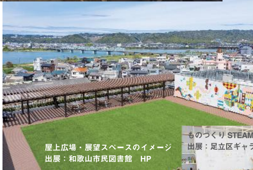
屋上広場・展望スペースのイメージ