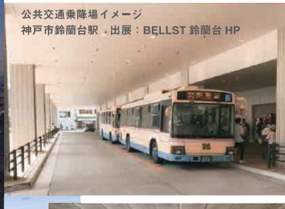
公共交通乗降場イメージ 神戸市鈴蘭台駅