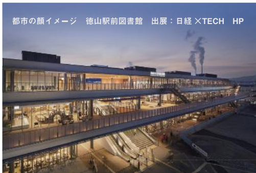
都市の顔イメージ 徳山駅前図書館

市民の皆様に永く愛される施設とするために「こんな場所になったらいいな。」「こんなことが出来たら嬉しいな。」というご意見を是非お聞かせください。「みんなで作るエキキタ」にしませんか？