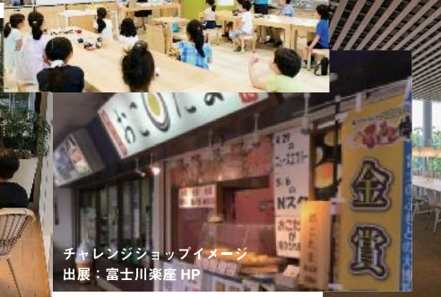
チャレンジショップイメージ