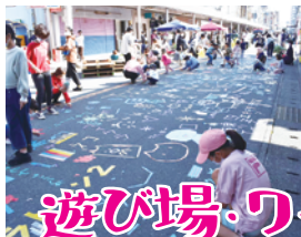
遊び場・ワークショップ