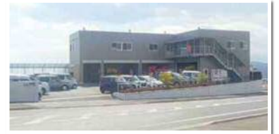
11街区 1号地：株式会社イー・オール・エス 様 令和2年7月稼働