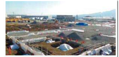
6-2街区 5号地：五條製紙株式会社 様 物流倉庫建設中 令和3年秋ごろ竣工予定