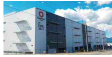
2 街区：大和ハウス工業株式会社 様 マルチテナント型物流施設 令和2年4月竣工