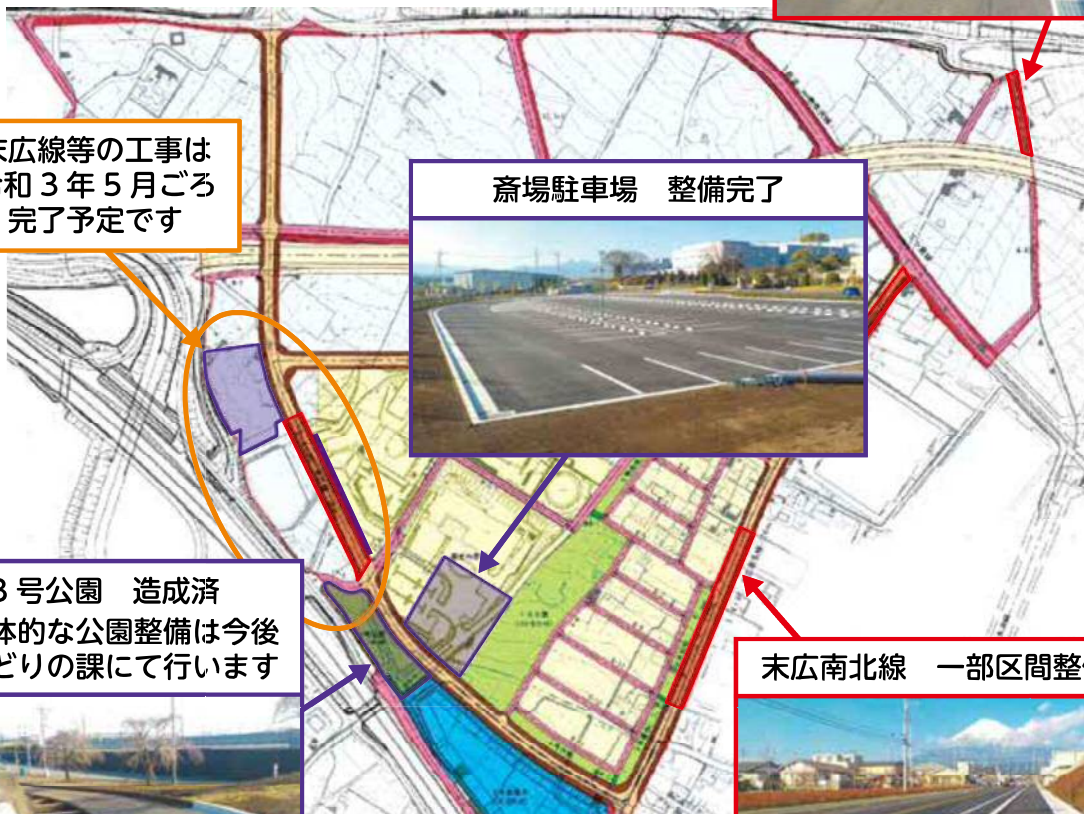
斎場駐車場 整備完了