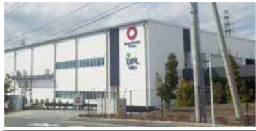
1 街区：大和ハウス工業株式会社 様 マルチテナント型物流施設 平成29年10月稼働