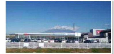
4-1街区：株式会社パロー 様 大型スーパー 平成29年7月開店