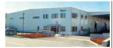
10街区 3号地ほか： ビヨンズテクノ株式会社 様 令和2年5月稼働

令和3年度は、末広線・末広南北線の道路工事、20街区の造成工事、2号調整池の整備工事などを行います。 工事に伴い、規制等が発生する部分もありますが、御理解・御協力をお願いいたします。