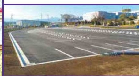
斎場駐車場 整備完了