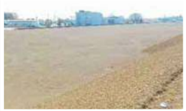
6-1街区：大和ハウス工業株式会社 様 平成30年4月引渡し済み