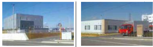
6-2街区 6-1号地ほか：日本郵便輸送株式会社 様 (写真左) 6-2街区 6-2号地：東海輸送株式会社 様 (写真右) 平成30年7月稼働