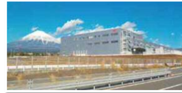
3 街区：日本郵便株式会社 様 平成29年2月稼働