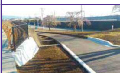
3号公園 造成済 ※具体的な公園整備は今後 みどりの課にて行います