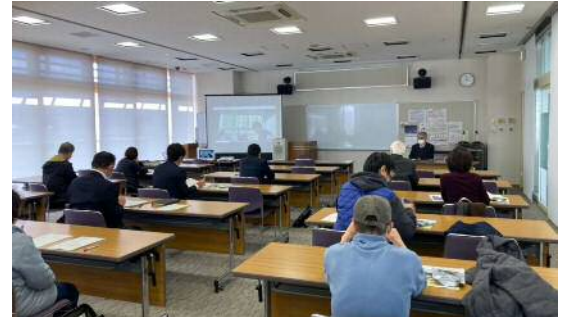
検討会の開催の様子