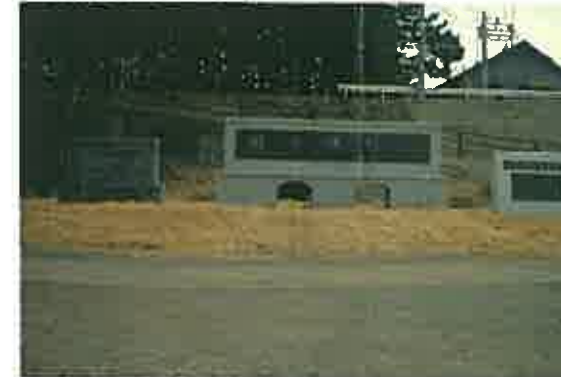
入道川樋門（左：昭和9年完成）田子浦樋門（中：昭和28年完成）の銘板をモニュメントにしました 記念碑（右）には入道樋門の由来が刻まれています