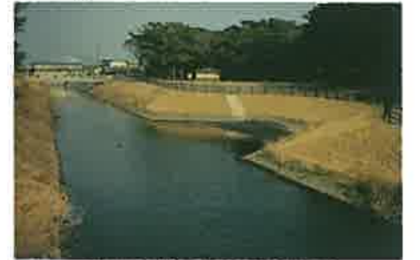
下堀川を身近に感じることができます