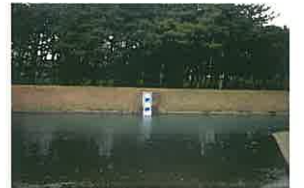
干潮・満潮の潮位の変化を観察することができます (水位標の0.0=海拔0.0mです)