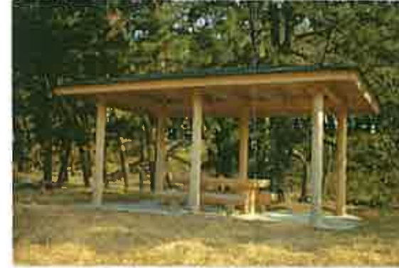
下堀川越しには富士山が望めます