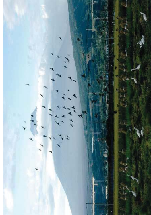
東部市民プラザ周辺