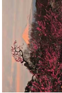
左下：富士緑道 右：中央公園