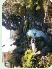
原田湧水池公園 (原田)

今泉・原田・吉永地区 は湧水が豊富で、 「泉の郷」といわれる 湧水を活かした施設が 数多く存在している