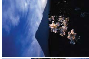
右下：大淵第二小学校周辺