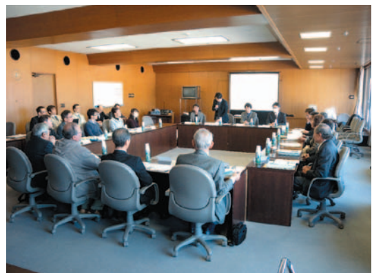
市民会議の開催状況