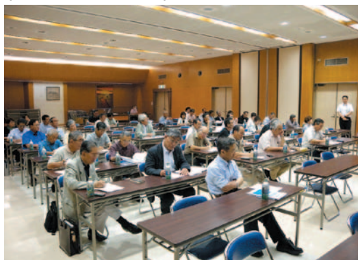
〈オリエンテーション〉