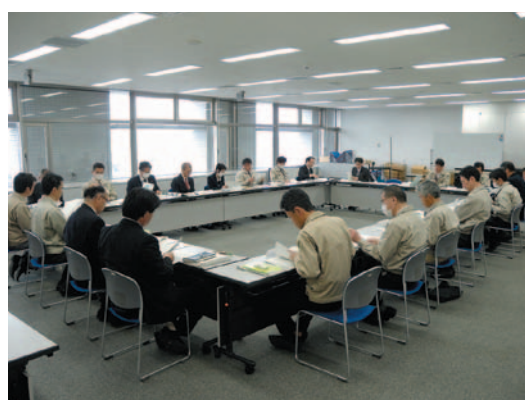
庁内検討委員会の開催状況