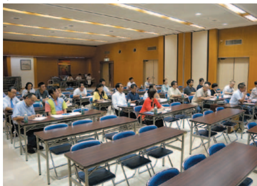
〈オリエンテーション〉