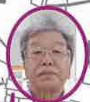
ヴィラージュ富士 厚原南