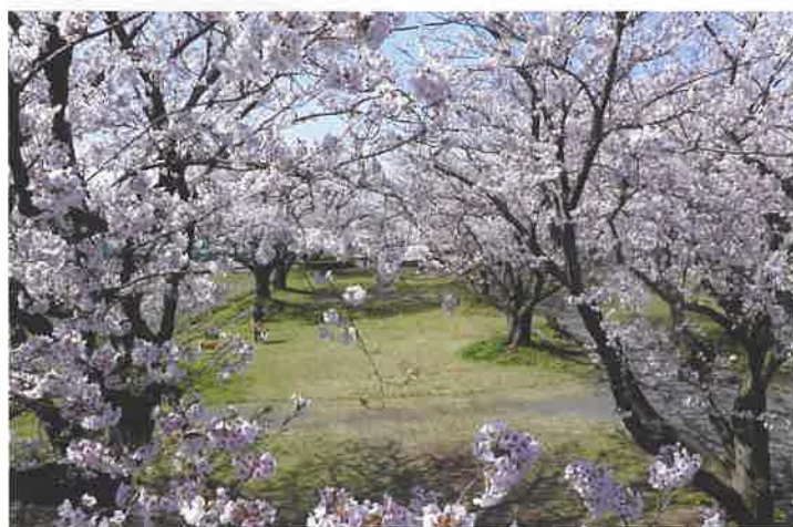
中止となったさくらまつり会場 令和2年(2020年)4月5日撮影