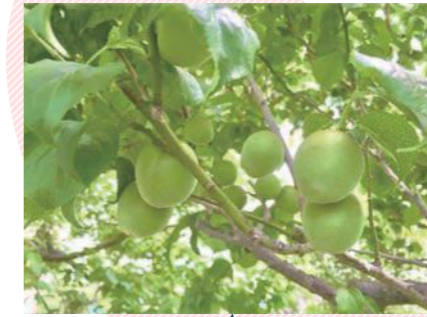
まちづくりセンター 梅の木