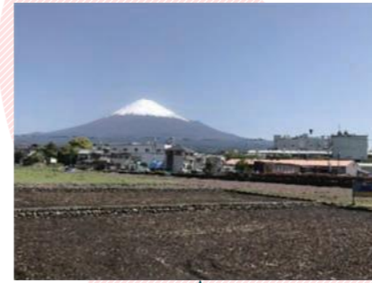
天間小学校 天間っ子田んぼ