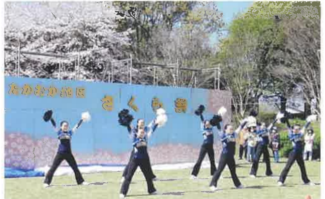
📷 「C-STAR」のダンスパフォーマンス

桜映えの青空と春本番の陽気とが重なり、会場内に設けられた飲食や物販などの20店舗余の模擬店は、どこも長蛇の列で賑わっていました。