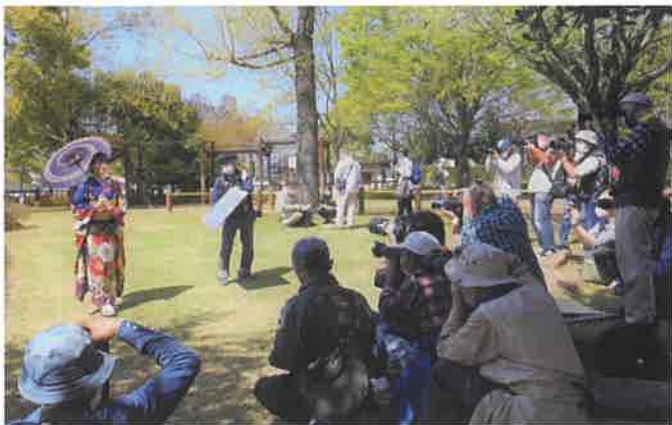
📷 さくら姫(第37代かぐや姫クイーン)をモデルに写真撮影会

また、写真撮影会では腕に自慢のアマチュアカメラマンが参加。今回も写真コンクールが組み込まれ、作品審査の後、その入賞・入選作品展を5月18日(木)から同31日(水)まで、まちづくりセンターにおいて