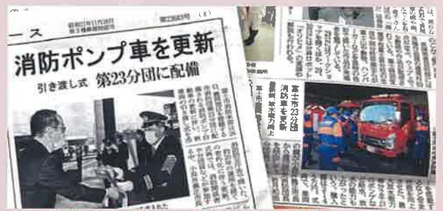
消防防災庁舎で行われた納車式を伝える新聞

約20年余の運用を経ての老朽化による更新で、新ポンプ車は、ドライブレコーダーやコーナーセンサー、衝突軽減装置などを搭載しており、旧ポンプ車に比べ安全面が各段に向上。最大放水能力は毎分2000ℓで、吸い上げ力や放水能力も高まっています。