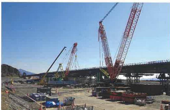
最終段階の架設作業（2月21日に撮影しました）

橋梁部は、今年2月末に大型クレーンを投入しての架設作業が終了、その威容を見せています。