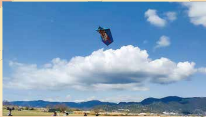
凧揚げ大会のみ 三四軒屋と千鳥町の凧が揚がりました!!