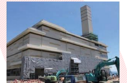
新環境クリーンセンター