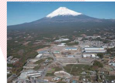
フロント工業団地