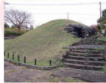
史跡実円寺古墳公園