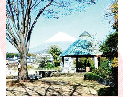
富士山の見える公園