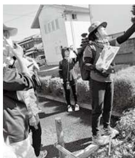
XC10 「草花さんぽ(松野)」 昨年度の様子

Instagramで、まちづくりセンター講座や青年教養講座、市民大学などの活動の様子や、募集のお知らせを発信しています！ぜひチェックしてください♪