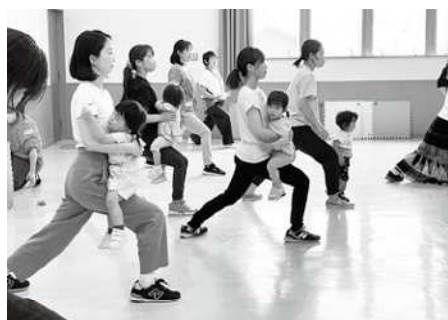
XH06 「ぷくぷくパンダ(富士川)」 昨年度の様子