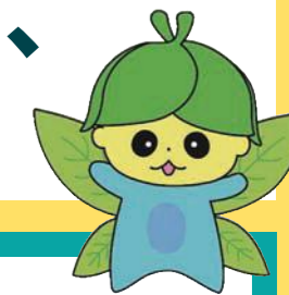
青葉台地区 イメージキャラクター 「茶助」