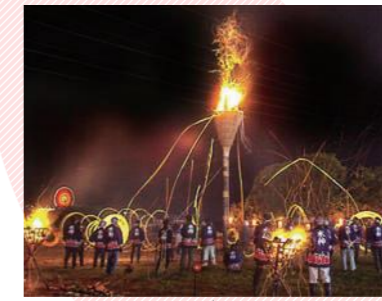
かりがね祭り(投げ松明)