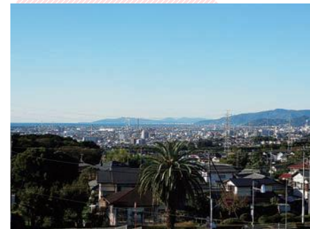
富士見台からの眺望