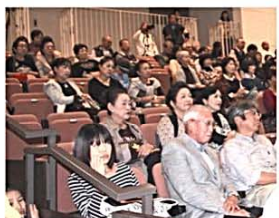
高校生の新鮮なアイデアに熱心に聞き入っています。