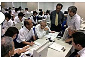
最優秀提案を決める話し合いも白熱しました。

担当された高校の先生方は生徒たちの変化を感じたそうです。「日頃の学習などではできない貴重な経験になったと思います。地元のみなさんの思いに直に触れることで、自分たちがまちに貢献することを意識していきました。1つでも多く実現されることを期待しています。」と話されていました。