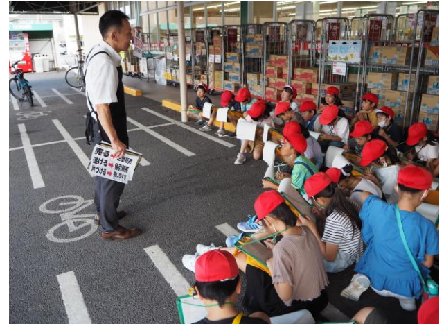
【3年生 スーパーの見学】