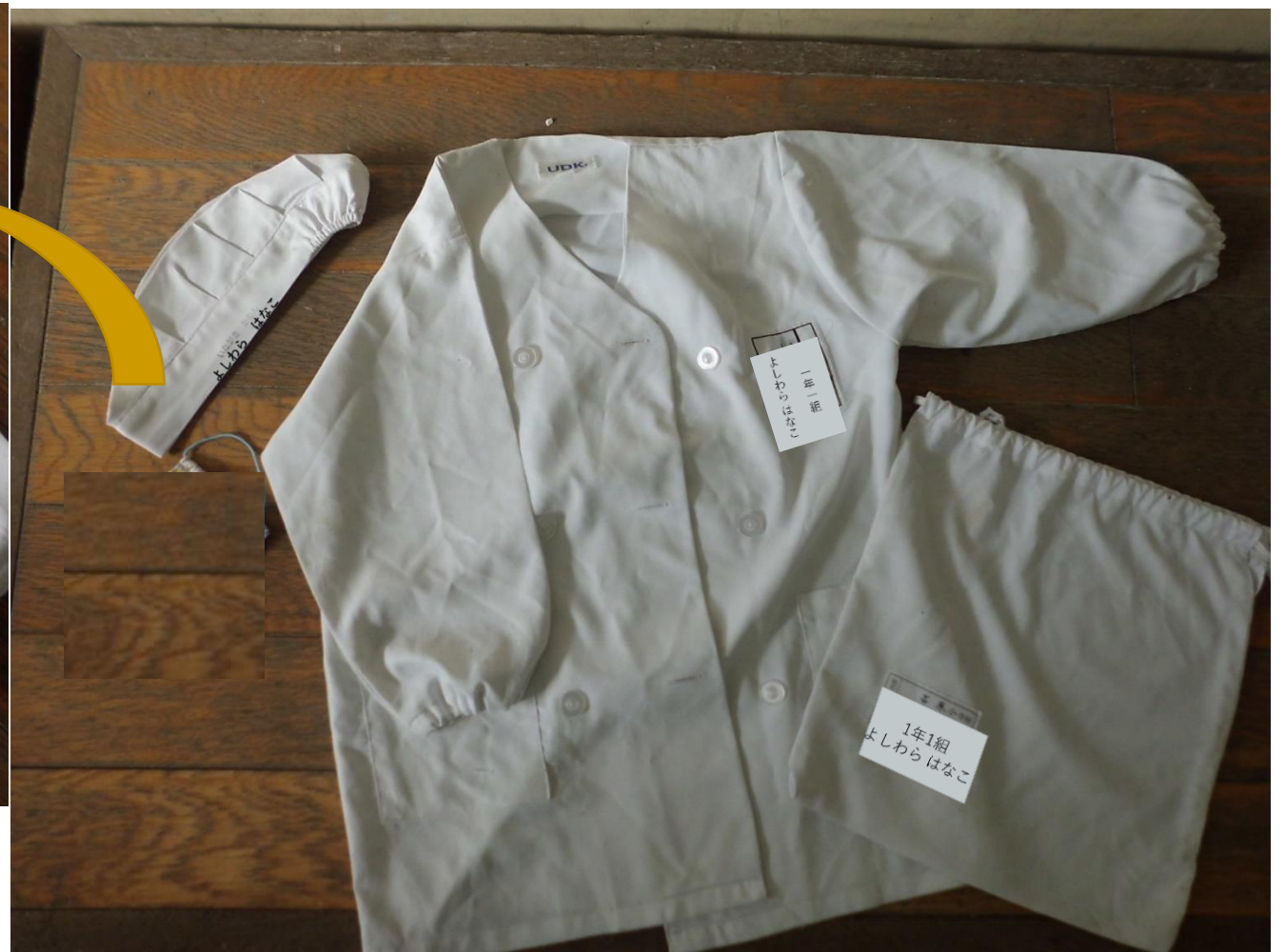
① 白衣と帽子とマスク