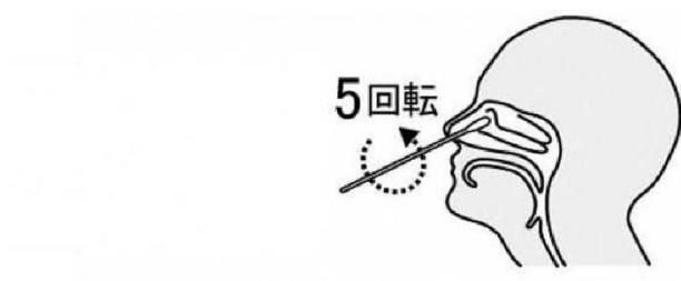
鼻腔ぬぐい液採取