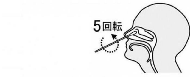
鼻腔ぬぐい液採取