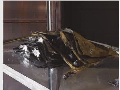
「Sheaf and Stalk #4, (detail)」