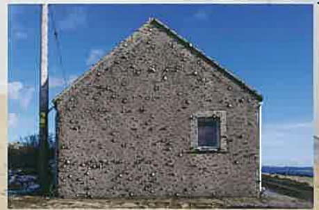
「蝶瞰図」 Butterfly's eye view「Heathery braes installation」 Orkney Scotland 2010 蝶図鑑から図版のみを切り離し屋外に設置中の風景 オークニー島 スコットランド 2010

渡辺 英司 1961年 愛知県に生まれる 1985年 愛知県立芸術大学彫刻科卒業 2004-2005年 文化庁芸術家在外派遣研修員としてスコットランドに滞在 (エジンバラ芸術大学客員研究員)