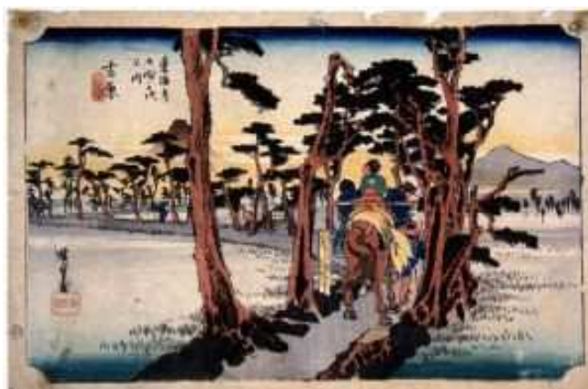
歌川広重 『東海道五十三次』 吉原 左富士

富士市の起こりは古く、6千年ないし 7千年前から人類が住んでいたことが、 市内に点在する縄文時代の遺跡、古墳群 等によって分かります。