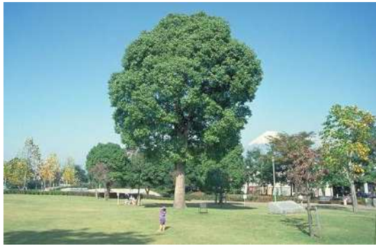
市民の木 くすの木