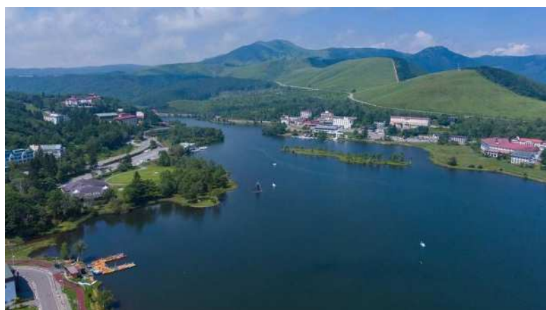
白樺湖（「無限∞のキズナ」実施予定地）