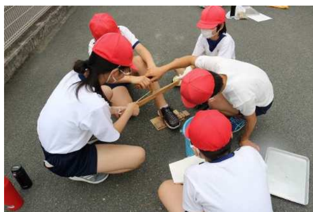
火おこし体験（大淵一小）