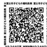
富士市子どもの権利条例