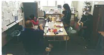
適応指導教室「ステップスクール・ふじ」