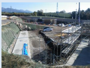
雨水調整池工事の様子