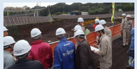
環境監視委員会による現地確認

市では、工事の状況や環境測定の結果を、地元である青葉台地区、大淵地区合同で設置していただいた「環境監視委員会」に報告しています。2017年10月18日（水）には、環境監視委員会の皆様に、現地の状況を確認していただきました。現地では測定器を用いて、直接環境測定の数値を確認していただくとともに、調整池の岩盤掘削時の音を体感していただきました。