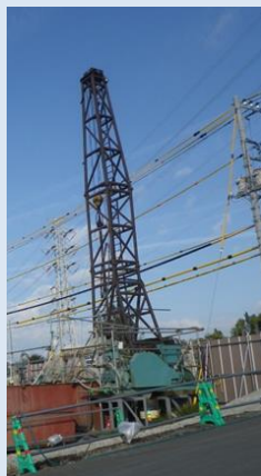
さく井工事の様子