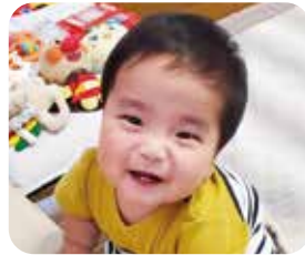
とうまちゃん R 4.11月生 生まれてきてくれてありがとう。いっぱい笑って大きくなってね!