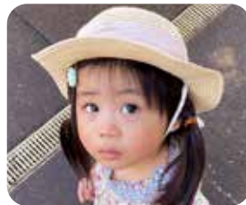
えまちゃん R 3. 5月生 いつも幸せな時間をありがとう。大好きだよ!!