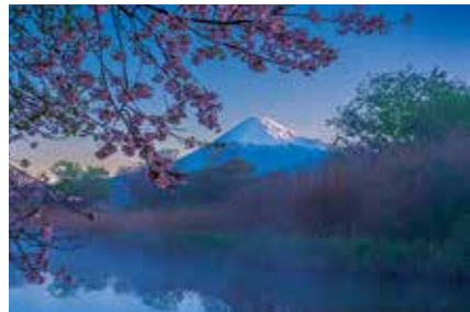
第18回グランプリ作品

※市ウェブサイトでの応募に不安がある人向けの申請サポートを行います。 ※詳しくは、11月下旬発行予定の応募要領(市役所2階総合案内・5階交流観光課、新富士駅観光案内所、各地区まちづくりセンターで配布)をご覧ください。