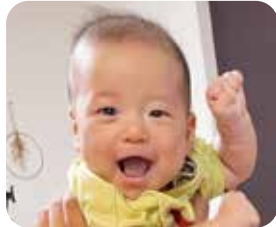
がくちゃん R 5. 4月生 生まれてきてくれてありがとう!たくましく元気に育ってね!