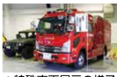
▲特殊車両展示の様子