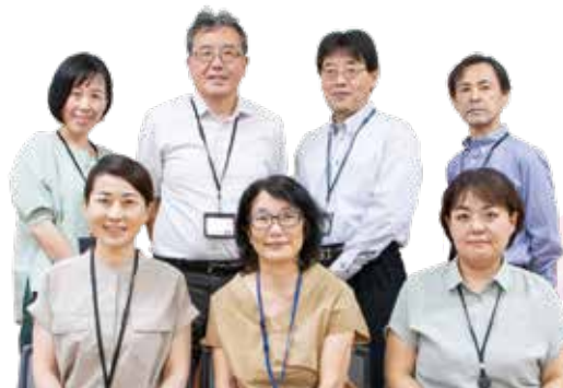
就労支援員の皆さん