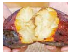
▲焼き芋にすると皮から蜜があふれ出す