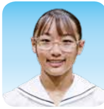
スポーツ(陸上競技)