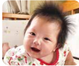
きおりちゃん R 5. 5月生 いっぱい笑って元気にすくすく育ってね。大好きだよ!