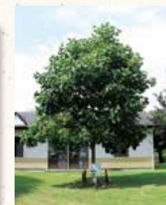
米の宮公園内の被爆2世アオギリ(平成27年に宣言30周年を記念し植樹)

核兵器廃絶平和宣言都市 富士市は、昭和60年11月19日に「核兵器廃絶平和都市宣言」を行いました。この宣言は、戦争のない平和な世界を実現させるため、非核三原則を遵守し、全ての核兵器の廃絶を求めることを富士市民の総意とするものです。 宣言以降、富士市は平和活動を推進し、様々な取組を行ってきました。 ▲詳しくはこちら