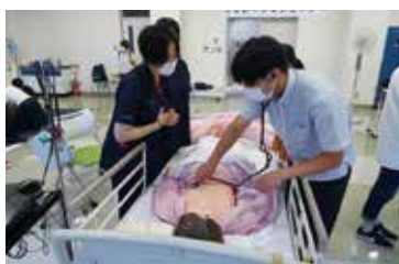
▶オープンキャンパスの様子

★入学試験の詳細は、市立看護専門学校ウェブサイト「令和6年度学生募集要項」をご覧ください。 ※過去2年分の入試問題を市立看護専門学校ウェブサイトで公開しています（解答は全て非公開）。