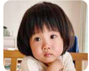
おとはちゃん R 3. 8月生 2歳おめでとう!これからも元気で明るく育ってください♥